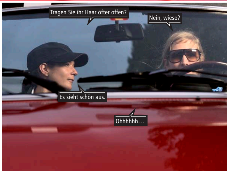
Tragen Sie ihr Haar öfter offen?