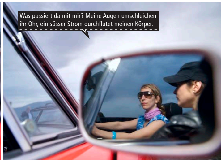
Was passiert da mit mir? Meine Augen umschleichen ihr Ohr, ein süßer Strom durchflutet meinen Körper.