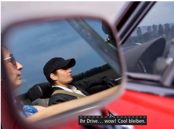
Ihr Drive... wow! Cool bleiben.